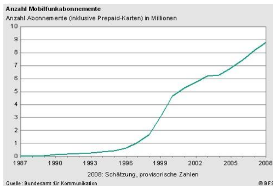
Diagramm 1 Der erneute Anstieg des Zahlenwachses um 2003/04 ist auf das Aufkommen von günstigen Prepaid-Angeboten der Grossverteiler Migros und Coop zurückzuführen.

Der Mobilfunkmarkt in der Schweiz ist in den letzten Jahren bekannterweise stark gewachsen. Inzwischen kommt statistisch gesehen mehr als ein Handy-Vertrag auf einen Einwohner. (siehe Erreur ! Source du renvoi introuvable.) Diese Entwicklung dürfte sich in den nächsten Jahren deutlich verlangsamen, da sich eine Sättigung des Marktes abzeichnet. Hingegen dürfte der Trend zu Smartphones und anderen mobilen Geräten, die zum mobilen Surfen anregen weiter anhalten.