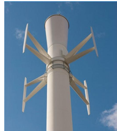
Abbildung 1 Neue Mastsysteme könnten sich in Zukunft je nach Windsituation selbst mit Strom versorgen.

Ein anderes Projekt zur Energieeffizienzsteigerung speziell bei Masten wurde vor drei Jahren vom Kommunikationstechnologiekonzern Ericsson vorgestellt. [4] Es verbindet ästhetisch ansprechende Mastenformen mit neuesten Erkenntnissen zum Bau von Kühlungssystemen. Ein weiterer Vorteil ist die Möglichkeit, den Mast mit einem vertikalen Windturbinensystem auszustatten, das je nach Witterung eine Selbstversorgung mit Strom erlaubt. [5] (Abbildung 1)